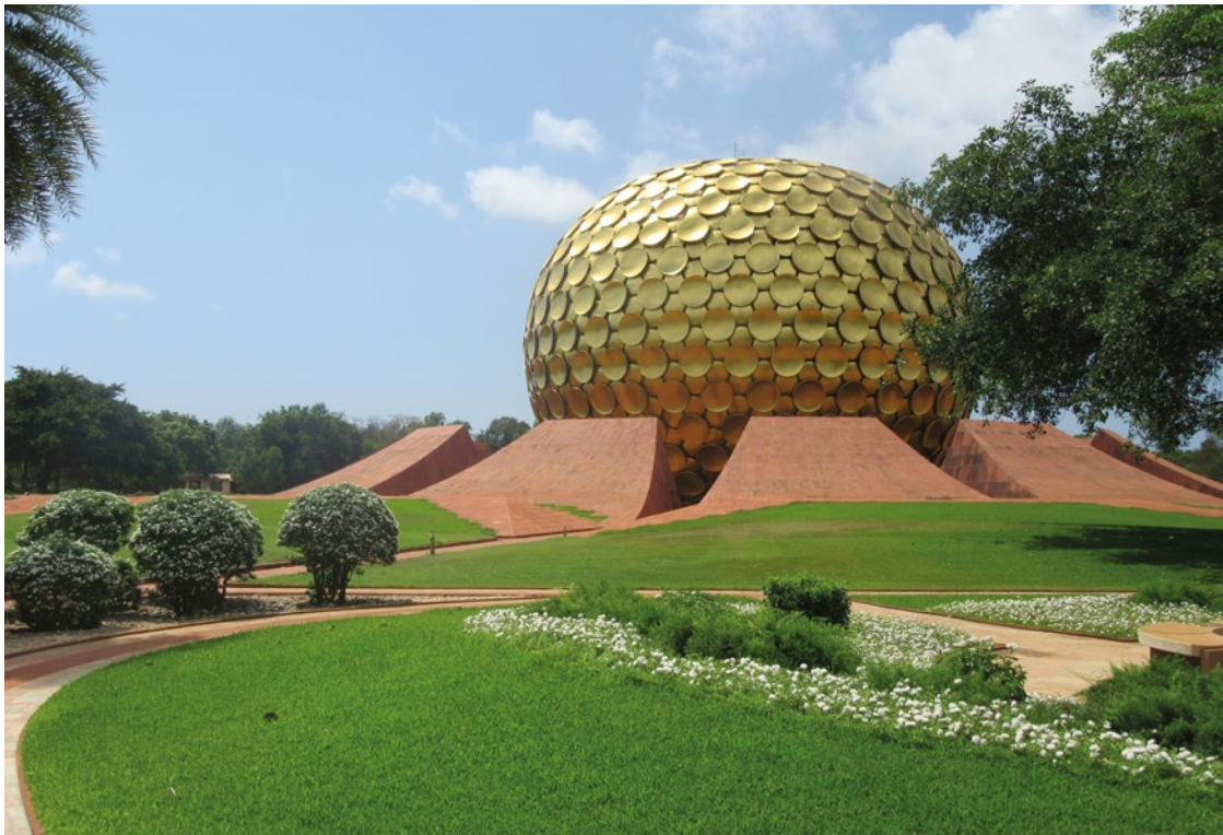
Figure 1. Le Matrimandir. Photographie de l'auteur, 2018.

cœur de ce modèle hélicoïdal trône le Matrimandir (« temple de la Mère »), unique édifice à vocation spirituelle de la cité (selon les termes des Auroviliens) : une sphère d'une quarantaine de mètres de haut, couverte de disques dorés à l'or fin, qui surgit d'un socle de terre rouge (Figure 1) et annonce, selon le symbolisme officiel, l'avènement de cette « nouvelle espèce » (Satprem 1974). Sa construction a duré plus de 35 ans, l'achèvement d'un travail communautaire dont a été tiré un film 8 et un livre Matrimandir. Un Hymne aux Bâisseurs du Futur (Darr 2015) qui circulent tous deux au sein des réseaux des Auroviliens et des sympathisants.